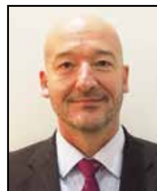
Thomas GOTTSCHALK Germany